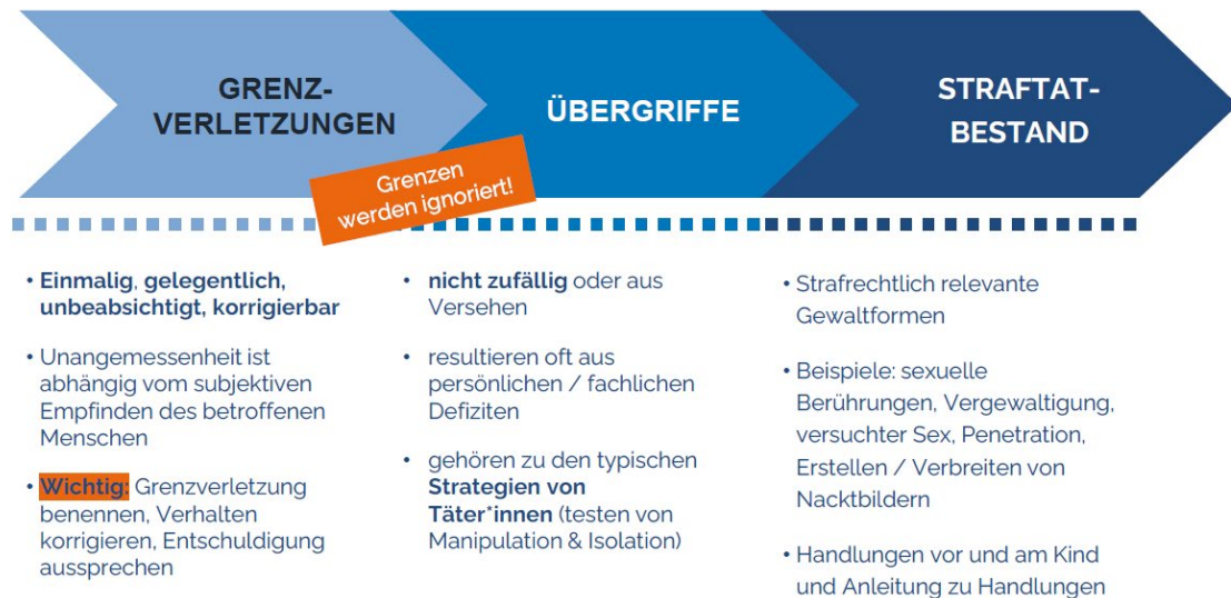
Abbildung 1: Stufen von Gewalt

Weiterhin kann Gewalt in unterschiedliche Stufen eingeordnet werden. Der KSB Mettmann und seine Sportjugend unterscheiden zwischen Grenzverletzung, Übergriffen und Straftatbeständen (Abb. 1).